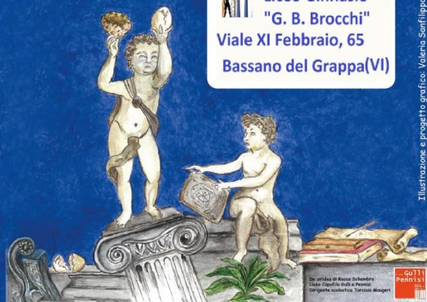
Illustrazione e progetto grafico: Valeria Sanfilippo